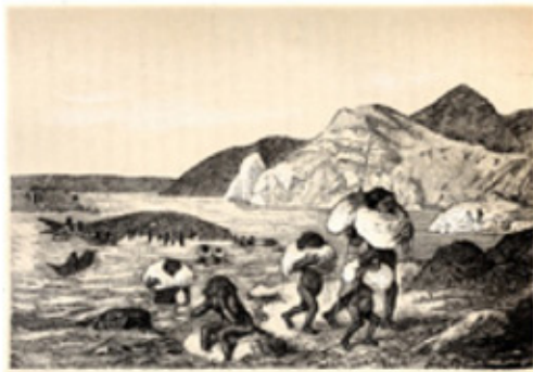
Balleneros, loberos, misioneros siglo XVI-II-XIX. Sergio E. Caviglia. P 60.

Las ballenas usualmente eran aprovechadas en sus varamientos, en donde se reunían muchas familias para compartir el alimento. En estas ocasiones eran propicias entre los yámanas para realizar las largas ceremonias del Chiejaus y el kina 17 . Gusinde relata que En la Patagonia Occidental, era generalmente una ballena varada la que convocaba mucha gente . Esas ocasiones eran propicias para convocar a la ceremonia de iniciación o Kálakai entre los "Halakwulup" [alacaluf o kawéskar] 18 .