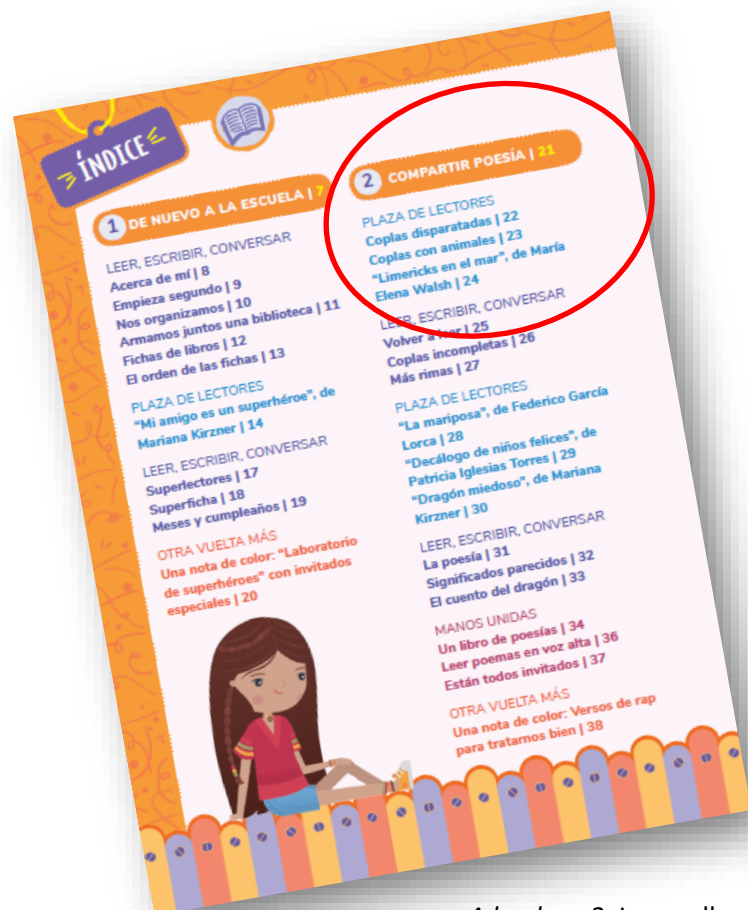
A la plaza 2, Longseller, 2020